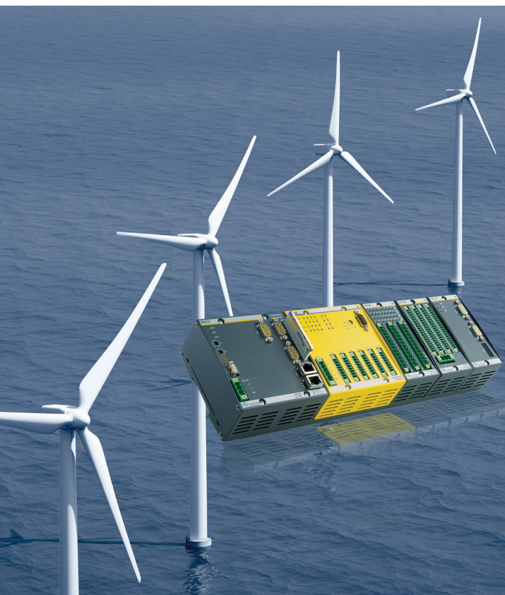
Bild 1. Das Bachmann-M1-Automatisierungssystem mit integrierten Sicherheitsmodulen bietet auch im Offshore-Bereich hohe Sicherheit

Windenergieanlagen werden als Maschinen eingestuft und unterliegen somit der Maschinenrichtlinie 2006/42/EG. Entsprechend müssen sie die Anforderungen nach funktionaler Sicherheit erfüllen. Modernen Sicherheitslösungen unter Verwendung einer programmierbaren Sicherheitssteuerung bieten heute vielfältige Möglichkeiten. So kann damit eine sichere Fernüberwachung und Fernwartung in Kombination mit intelligent eingesetzten Redundanzen die Verfügbarkeit sicherstellen und sogar verbessern. Bachmann Electronic bietet dazu ein komplettes Sicherheitspaket.